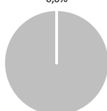
1. Alignement à la taxinomie des investissements obligations souveraines comprises*

100,0% • Alignés sur la Taxinomie : gaz fossile • Alignés sur la Taxinomie : nucléaire • Alignés sur la Taxinomie (hors gaz et nucléaire) • Autres investissements