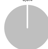
2. Alignement à la taxinomie des investissements obligations souveraines exclues*

100,0% • Alignés sur la Taxinomie : gaz fossile • Alignés sur la Taxinomie : nucléaire • Alignés sur la Taxinomie (hors gaz et nucléaire) • Autres investissements